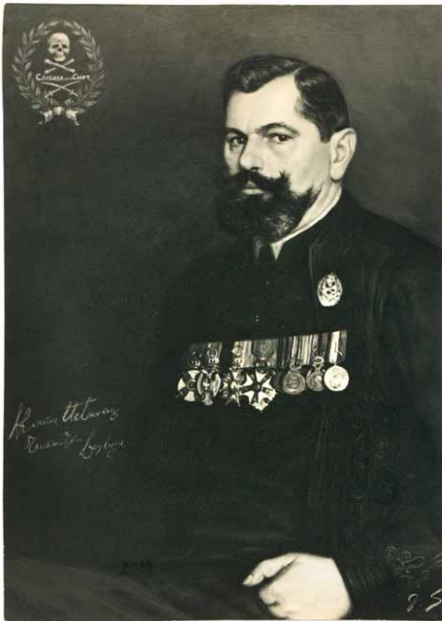
Војвода Коста Пећанац (Народни музеј Чачак)